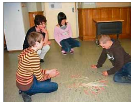
IF-Lehrperson in Bürglen (UR) am Bruchrechnen mit einer Gruppe von Kindern

Die Gemeindeschule Buchrain arbeitet seit Anfang dieses Schuljahres am Projekt: Lehren und Lernen in IF-Schulen (Integrative Förderung).