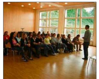
Themeneinführung für die LP von Buchrain.

Was wäre, wenn die Kinder in die Schule kommen würden, um Freude und Glück zu lernen. Wenn für die Rahmenbedingungen die nötigen Mittel zur Verfügung gestellt werden.