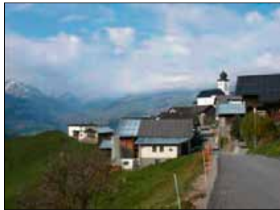
Romantisches Bergdorf Riein.

uw. Das kleine Bergdorf Riein (1270 m.ü.M.) liegt auf einer wunderbaren Terrasse, von der man einen atemberaubenden Blick in das Lugnez genießt; das Landschaftsbild des Dorfes wird von der gewaltigen Signinagruppe beherrscht, sodass Riein von vielen Wanderern und Bergsteigern geschätzt wird.