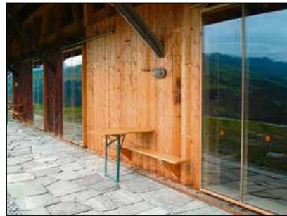
Das Ferienhaus Sagi Riein.