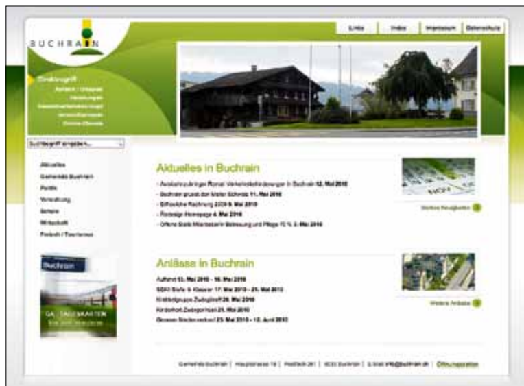
Die neue Homepage von Buchrain zeigt sich aufgeräumt.

Die Website der Gemeinde Buchrain ist seit Anfangs Mai mit einer vollständig überarbeiteten Struktur und einer spürbar entschlackten visuellen Gestaltung auf dem Netz.