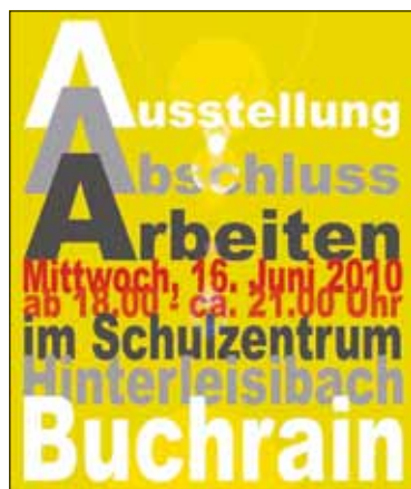
Plakat Abschluss-Arbeiten 2010.

Die SchülerInnen der neunten Klassen des Oberstufenzentrums Hinterleisibach präsentieren in einer Ausstellung ihre Abschlussarbeiten.