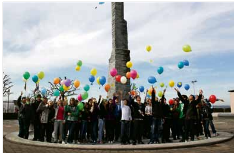
Zum Abschluss lassen die Jugendlichen bunte Ballone mit dem Slogan «Bueri kennt respect – du auch?» steigen.

Auch in diesem Schuljahr werden die Abschlussarbeiten im Rahmen einer Ausstellung präsentiert. Diese findet am Mittwoch, 16. Juni 2010, zwischen 18.00 und 21.00 Uhr im Zentrum Hinterleisibach in Buchrain statt und ist allgemein zugänglich. Erfahrungsgemäss findet diese Ausstellung jeweils ein breites Publikum und es ist für die Schülerinnen und Schüler eine wertvolle Erfahrung, für einmal nicht nur von der Lehrerschaft, sondern auch von einer breiten Öffentlichkeit Rückmeldungen zur geleisteten Arbeit zu bekommen.