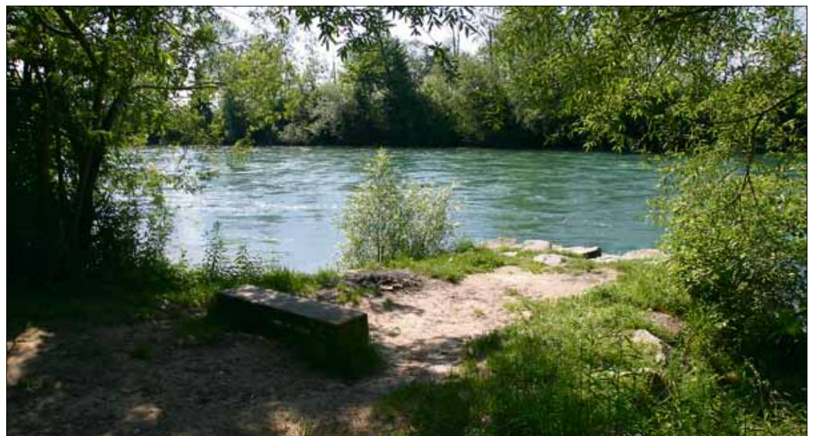
Übrigens hat es in der Gemeinde Buchrain über 60 Sitzbänke»

hi. Das Reussufer mit seinen acht Buhnen ist seit langem ein sehr beliebtes Ausflugsziel für Jung und Alt aus nah und fern. Auch dieses Jahr wurden wieder für die Dauer des Sommers bei der zweiten Buhne ein Abfall- und ein Glascontainer gestellt. Trotz diesen Entsorgungsmöglichkeiten kommt es immer wieder vor, dass Abfall liegengelassen wird. Es handelt sich dabei in der Regel nur um Picknickabfall und vielfach ist die Verschmutzung leicht. Je weiter vom Container entfernt, desto eher wird gelittert. Deshalb führen auch heuer an schönen Wochenenden und während den Sommerferien die Polizei und ein privater Sicherheitsdienst sporadisch Kontrollgänge durch. Dabei können Personalien aufgenommen